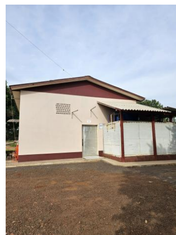
Fachada da Agroindústria